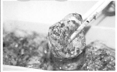
8個で500円。ちよっと高いか?と食べてみる。が、形も具も大きく食感ももちりてで満足度大