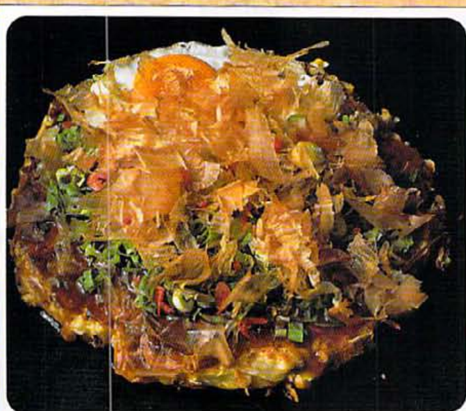
お好みスペシャルきん太 (イカ・エビ・タコ・生ねび・ホタテ・玉子入り) 1700円。ソースは甘・辛の糖類あり。

「チャンス エンカウンター」とは、「突然の出会い」の意。言ってみれば「犬も歩けば棒に当たる」ってこと。ここではクラブフェイムが出会った良心店を、ラインナップ。好評につき、レギュラー化!