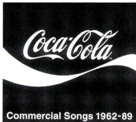
1962～89年までの54曲が収録する75分強！中でも「カミンホーム」の海外編は新録！ダイアナロスの「スカウトヤセカ」ってな愛な日本語肉声。収録して欲しかったなあ。超インパクトなジャケットデザインはもちろココレッド、コクライン、フランク・M・ロビンソンの薄記ロゴ、ペンバートン博士も草葉の陰できつと突ってます

高度成長期生まれの人達にはもう喉から手が出るほどのあの「コカ・コーラ」のコマソンがついにうぶ出し、その全貌を現わした。マツケンエリックソン時代のCFを見た人なら、このアンビリュー100%のクリア音源を聞けば、その情景は走馬灯ワールド満開！「意見が合うのは」では、幼馴染みが得棋番をひっくり返すシーンが、「青い空から」のフォーリーブスでは、黄色い歌声(SEE未収録は残念)と彼らが軽やかに踊る「ライブシーン」が、2枚目の佐藤竹善の「Feel」ではお膝元、花見小路辺りで爽やかに笑顔を見せる舞妓ちゃん涙で思い巡るのです。ライナーの資料性も極めて高く、まずはこれを企画したチームにスタンディングオベーション！お次はもうDVD発売しかない！