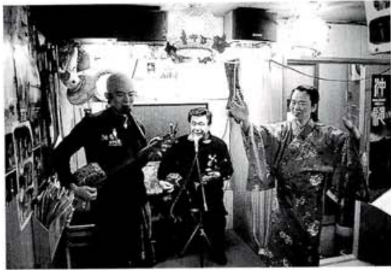
本店では、毎夜ショーが、マスター、ママ、スタッフに、客が弾くピアノやバイオリンも加わったりと、賑やか