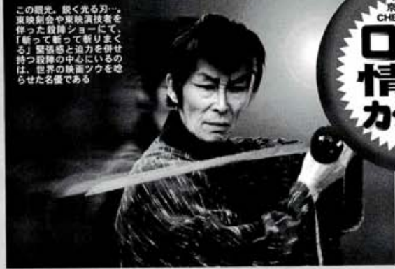
この眼光。鋭く光る刀。東映新会や東映演義者を伴った殺陣ショーにて、「斬って斬って斬りまくる」演出時と力を併せる時、世界の中心に在るの地を、世界の映画ツウを魅了させた名演である