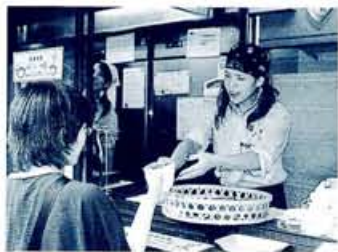
四条通に面した店舗は、100円パークの一角に、人が食べているのを見ると、つい自分も欲しくなる不思議な魅力、恐るべしカレーパン