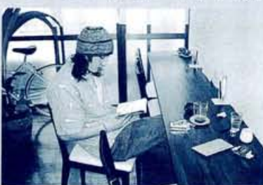
「10年開いてない人に、手紙を書きたいけど」とつぶやくお客さんいいたとか、彼は一体誰のために書いたのだろう

なぜ人が手紙を書かないかって、それは便箋や切手を買ったり、せっかく時間を削いで書いたとしても投函するのを忘れたりするから。もしそんな手間が省けるなら、速く離れたアノ人や、久しぶり会ってないアノ人になっって手書きの文字で伝えたい...と駄々をこねる人を見かねたように、その全てを請け負うカフェがこちら、「私の喫茶店タイムは手紙タイムなんだ」と話すオーナーだけに、自分の店でポストカードや便箋、ペンや切手まで販売中、各机に揃ったエンピツや糊は自由に使える。「ん、でもポストに行くのが面倒で」と言う人に代わって投函代行のサービスも、この手紙見たらアノ人どんな顔するのか、なんてコーヒィを飲みながら考えるのも楽しいでしょ?