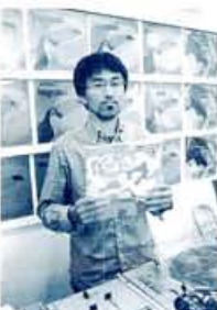
オススメはFuture Loop Foundation『Scrach&Sniff E.P.』1280円。「ジャケッットに誰かな香り付きの遊び心が良い」