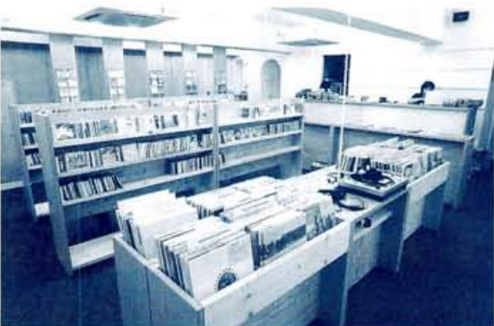
「ダンスといっても、HIP HOPやR&Bは扱ってないんです。ファッションで言えば、『タボついたB-BOY』ではなく、『フレンチホーダーのシャツ』のサラッとした感覚