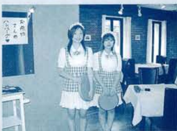
常時2名のメイドさん(笑)がフロアに待機

真っ白なスカートにストライプのエプロン、メイド姿の乙女が笑顔でお出迎え...と聞いてときまじくあなた、気負うことなくとにかく入店あるのみ。こちら九州産黒毛和牛や京都産もち豚を使用した「男のハンバーグ〜史上最強〜」。共に1日5食限定の「男のハンバーグ〜史上最強〜」「女のハンバーグ〜野菜畑〜」等、男女の境を飛び越えたって食べたい衝動に駆られる品がメニューに並び、しかし、男子大好き肉料理とスタッフたちのかわいさ故に男性客多し?と思いきや、意外にも女性客優勢かつユニフォームの評判も上々。スタッフのかわいいメイド姿は確かに「アタシも着たくらい」と思わせるに充分。そして確かにハンバーグだっていつもよりオイシイんです。