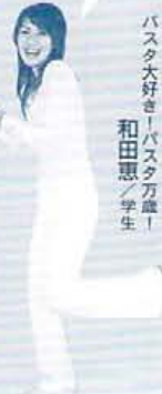
パスタ大好き! パスタ万歳! 和田恵 / 学生

1年次のインテリアデザイン設計科を修了すればインテリアコーディネーター試験。2年次の研究科まで進めば2級建築士試験を目指す学力・技術が身に付く