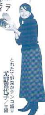
とれたて野菜がテイクアウト 尤野菜代子 / 主婦