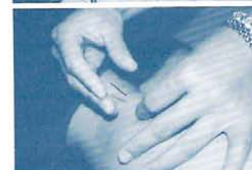
この「足三里」のツボは、暴飲暴食の増えるこの時期のクタクタになった胃を整えるツボ。鍼・灸5000円、他アロマ＆指圧マッサージもあ