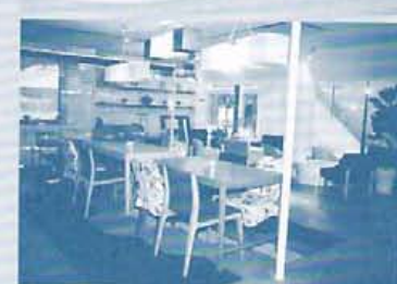
コースの予約時間は3日間とも17時30～19時30分、20時～22時の二部制。ライトアップする中庭の景色がクリスマス気分を盛り上げる