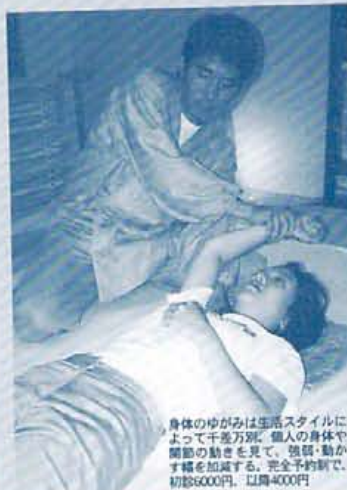
身体のゆがみは生活スタイルによって千差万別。個人の身体や関節の動きを見て、強弱・動かし難さを加減する。完全予約制で、初診5000円、以降4000円