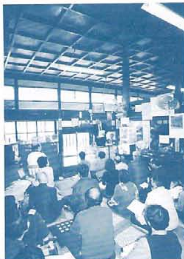
「湯快楽家 (2000円入浴付)」たる落語会はプロの落語家も本腰を入れるほどの熱気。年末には桂文治の出演が控える。取材時は熊本大教授とご主人の対談等が報じられて、題目は京事始めの一つ「公衆トイレと公衆浴場」で開催された。