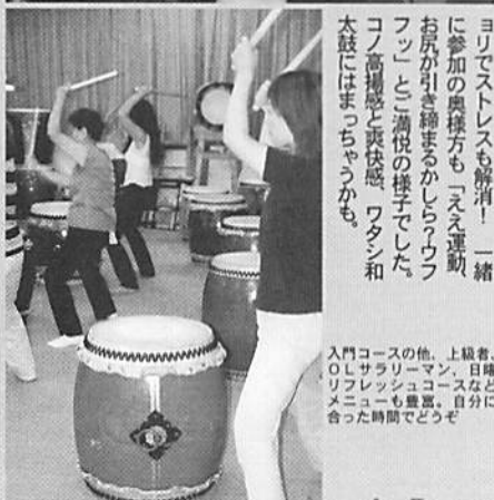
●太鼓センター 御池練習場 京都市中京区御池通室町東入ル 伊と幸ビルB1 075-813-8623 (太鼓センター本社)