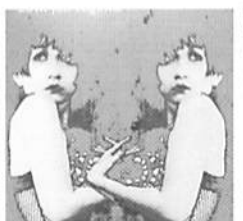
20th Jun Togawa / 戸川純 2000円 (税込) '80年代から様々な音楽活動に着手してきた、戸川純。そんな彼女がヘルベットのアンダーグラウンドやパティ・スミスなどの名曲をカバーしたアルバム