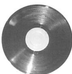
LOVE IN THE GHETTO / BLOOD SHANTI & THE SHANTITES

2625円 (税込) ヨーロッパのアンダーグラウンドシーンで人気のあるアバシャントのダブアルバム。現在までに「バイブス」が3回来日をサポート。来春にも再来日するかも?