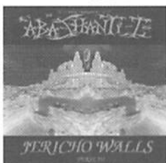
ABA-SHANTH Vol.3 JERICHO WALLS / ABA-SHANTH

2625円 (税込) ヨーロッパのアンダーグラウンドシーンで人気のあるアバシャントのダブアルバム。現在までに「バイブス」が3回来日をサポート。来春にも再来日するかも?