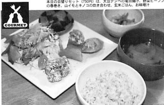
本日の日替りセット (750円) は、大豆テンペの竜田揚げ、野菜ビーフンの巻巻き、山イモとキノコの炊き合わせ、玄米ごはん、お味噌汁

3年間のアメリカ生活の中で、オーガニックフードやマクロビオティック(正食)への関心が芽生え、食への意識が一変。そんな思いから、誰もが身体に気がねせずにごはんが食べられるお店をついにオープン。私が調達してきたオーガニック食材を、ウチのシェフ(母)がその主婦経験をもとにいろいろな料理に変身。なかでも私達の一番のおすすりめ食材は「テンペ」なる物。「何ソレ?」ってな答えが返ってきたけど、これはインドネシアの食品で茹でた大豆をバナナの葉に包んでできる発酵食品。納豆によく似た製法だけど、はるかにクセは少なく淡白でいろんな味に対応するから、絶対日本人好み。騙されたと思って、私が愛するテンペの味を一度お試しを。