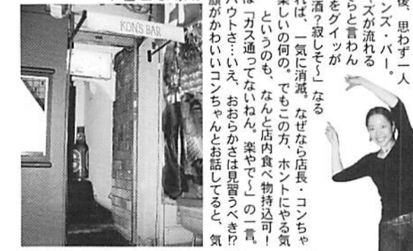
週末にはあのイラストレーター・安西水丸氏が来ることも、氏を經由して、猪木を囲む会を立案中だとか

NIGHTSPOT カウンター7席、奥のシートに10席、ボトルの間はカウンターとニオの木ボックス、どうやらファンらしい