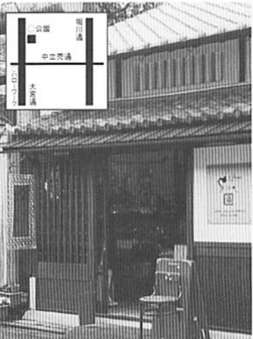
和洋中のジャンルにこだわらず、雰囲気のあるお洒落価格で飾りたい