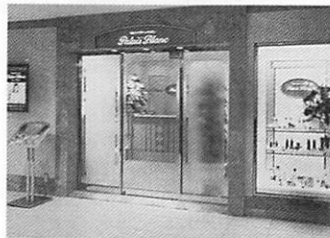
他にもアロマやタラソテラピーなど多彩なコースが揃う。自分へのごほうびとして通うのもよさそう

場所は大丸京都店7階。落ち着いた雰囲気の中、笑顔で迎えてくれる美人顔のエステイシャン達。普段味わえないゴージャスな気分になれるのが「パレ・プラン」。初めて行く人たちのためのトライアル5000円なら、美顔、脱毛、ボディの60分コースのうち一つが選べます。皮膚科学や栄養学など科学的な理論に基づいたエステはモチロン効果抜群。私がやったのは美顔コースで、まずはカウンセラーさんと一緒に食生活や肌の悩みなどを総合的に分析。自分にあった施術をみつけます。メイクを落とし、毛穴の汚れまでキレイに吸引したらオイルマッサージへ。肌質によりスベスベのスクアラン油が鎮静のローズ油を使い分け、約20分間のマッサージ。思わず眠っちゃう位の気持ちよさです。