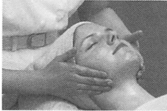
20才過ぎれば肌の老化が始まる。ストレスと疲れでポロポロだったならかなりやばいよね。早目に手はうってこう