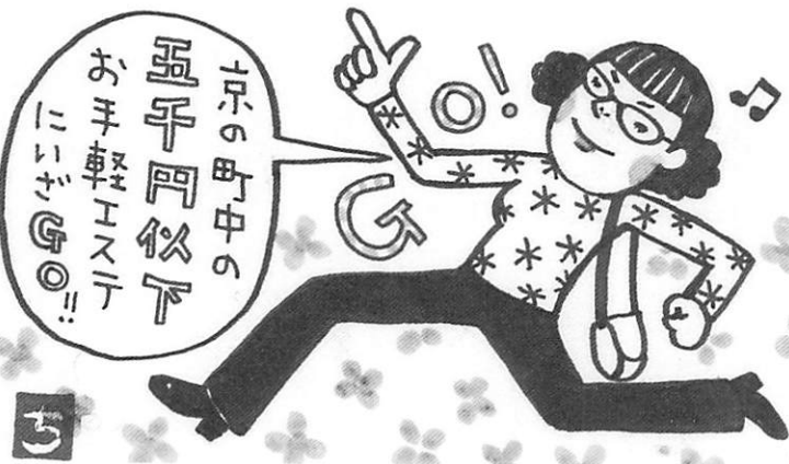
マッサージ足25分 2000円〜、首・肩・背中+足底35分3000円〜など。マッサージの部分、時間、強弱のクエストしてね

疲れたカラダにくだればれ気味のココロ。美味しいごはんや休日の睡眠も癒してくれるけど、カラダの芯から元気になるには、専門家に任せよう。それがイチバン。明朗会計の安心心リラクゼーションを訪ねてみよう。