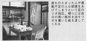
運ぶの足の自ツ った人うは まはとうに治 た人う。導り の足指。蒸紙 れずツ分ボ れ分ボ