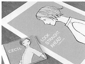
お洒落でのびやかな女の子のイラストは、funky802.comのロゴマークなどに愛用して街を賑わせている