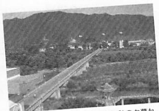
川は流れる小汚く、いずこも同じ秋の夕暮れ。

日本人の感覚では日本以外のアジア諸国の海や河川は綺麗なモノであり、そこで獲れる産物は安全と考えがち。