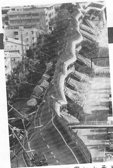
占ってようがなんだろうがこれが現実。