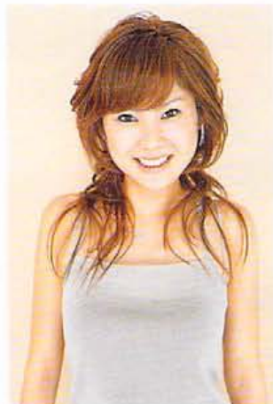
深みのあるオレンジ系カラーを活かしたナチュラルパーマが今季の旬

丁寧なカウンセリングを通じて、その人が持つ髪へのプラストレーションやライフスタイルの変化に対応するスタイルを提案。来春には市内に移転しリニューアルオープン予定