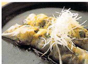
「結婚式で食べるより、こっちの方が断然美味しい!」と胸を張るロブスターのダクタン1600円。ライスベーパーで挑戦したホタテと、丹波地産の巻巻800円、丹波地産の巻巻とカッコーのサラダ950円