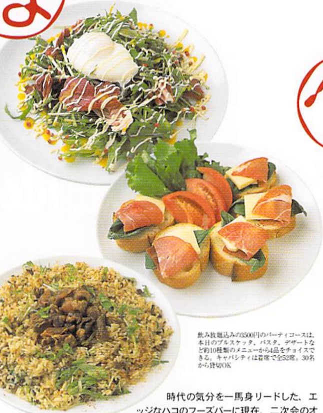
飲み放題込みの3500円のパーティコースは、本日のブルスケッタ、パスタ、デザートなど約10種類のメニューから4品をチョイスできる。キャバシティは着席で全52席。30名から貸切OK

時代の気分を一馬身リードした、エッジなハコのフーズバーに現在、二次会のオファーが殺到。「式のビデオを上映したい!」「では80インチの大画面で。」「披露宴の参加者ばかりが集まるの!」「ではデザートをメインにしましょう」…なんて、面倒見の良さに幹事さんはイチコロ。クールなようにハードフル、ってモテるタイプの条件やねえ。