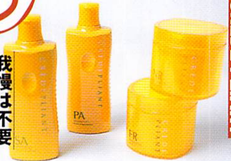
左からやわらかい髪に軽さと指通りをもたらすシャンプー SA2000円、かたい髪にやわらかさと動きを出すシャンプー PA2000円、シルエットをおさめるトリートメントFR2800円、サウササまとめるトリートメントNR2800円

水分量の少なさがその頑固さに拍車をかけて、まとまらずおさまらずのヒネクレ者、くせ毛。ならば水分をたっぷり補充してくせ毛の悩みを緩和、と登場したのがミルボンのCRÉDE PLIANT。髪質別シャンプー、仕上がりが感別トリートメントの実力はアツパレ。