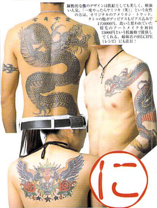
躍動的な顔のデザインは肌絵としても美しく、根強い人気。「一度やったらヤミツキ(笑)」という女性の方は、オリジナルのアメリカン・トウツド・タトゥーの他がアイピエラスもピアス込みで1穴6000円。高いと思われていた眉毛のアートメイクを初回15000円という低価格で提供してくれる、姉妹店のRECIPE(レシピ)にも注目!