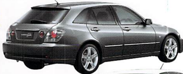
スポーツセダン「アルテツァ」の優れたプラットフォームを継ぐ「アルテツァ・ジータ」。3リッターエンジン、4WD採用モデルも発売される。メーカー希望小売価格2,180,000円～