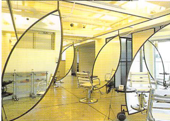
木の業型の大型ミラーはすべて可動する仕掛け。余分なモノを排除したモノクロームの店内で、鏡すらもミニマムに抑えられる

せっかくサロンへ来たからには、キレイに変身した自分を手に入れたい。そんな女のこの願いをがっちり受け止めるELKでは「たとえ伸ばしかけで短く出来ない髪でも、絶対に変身させてみせる」と心強いおコトバ。自分自身でも気づかない変身可能ポイントはまだまだあるのだ。髪で生まれ変わった後は無料のフェイスメイクで画竜点睛の仕上げを。