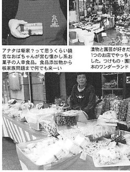
アナタは商家?って思うくらい鏡舌なおばちゃんが営む懐かし系お菓子の人幸食品。食品添加物から核家族問題まで何でも来ーい

京都市中京区壬生下満町51-41 TEL.075-311-0332 http://www.nscpa.or.jp