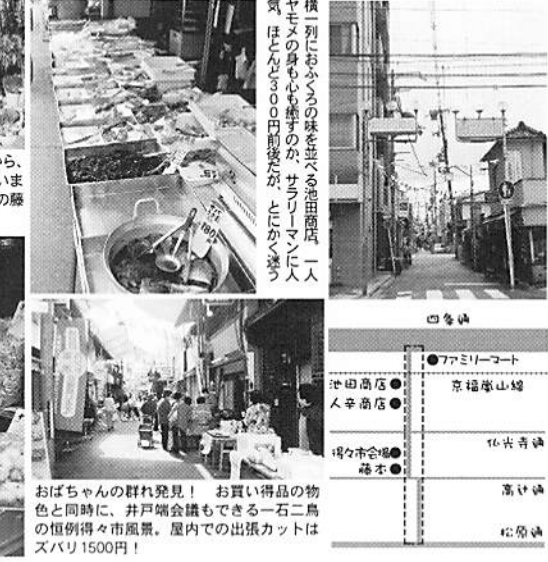
おばちゃんの群れ発見! お買い得品の物色と同時に、井戸端会議もできる一石二鳥の恒例得々市風情。屋内での出張カットはスバリ1500円!