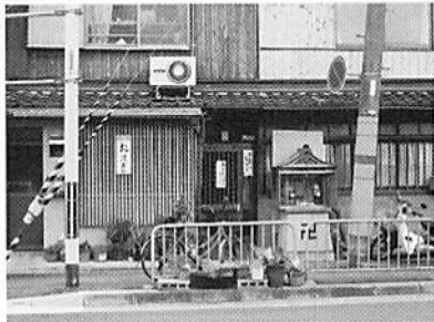
場所は東寺の西、京阪国道口の交差点を北へ一歩目の信号あたり。唯一の目印は張り紙のみ。近所の人には定番店