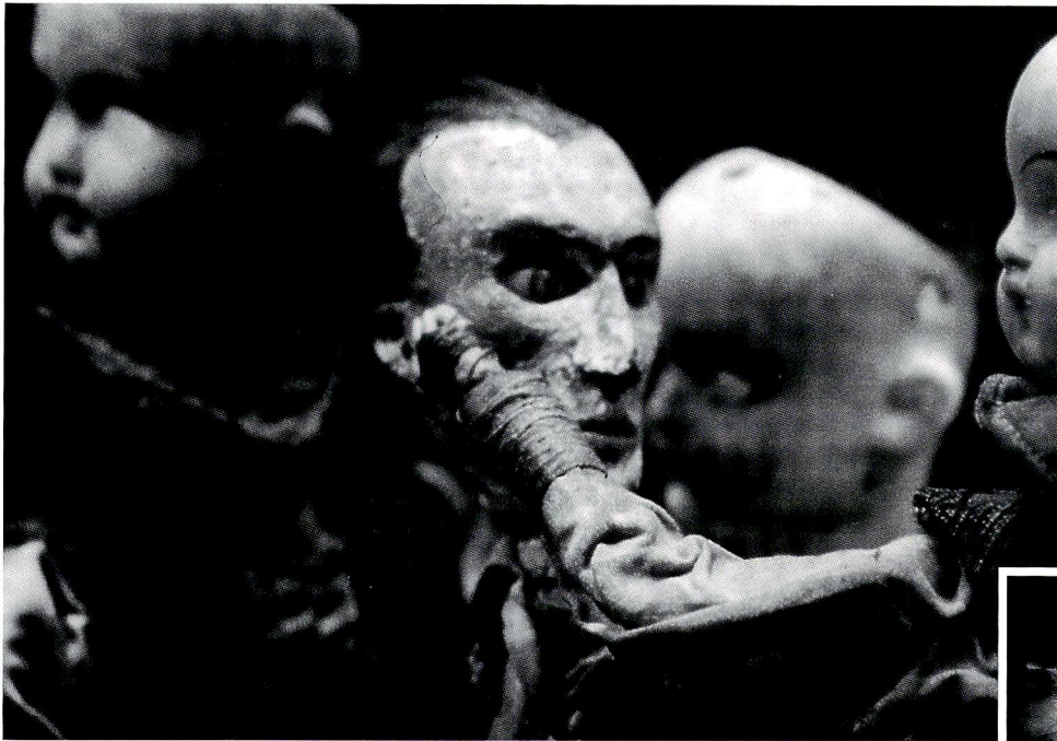
STREET OF CROCODILES © Koninck Studios Ltd.1985