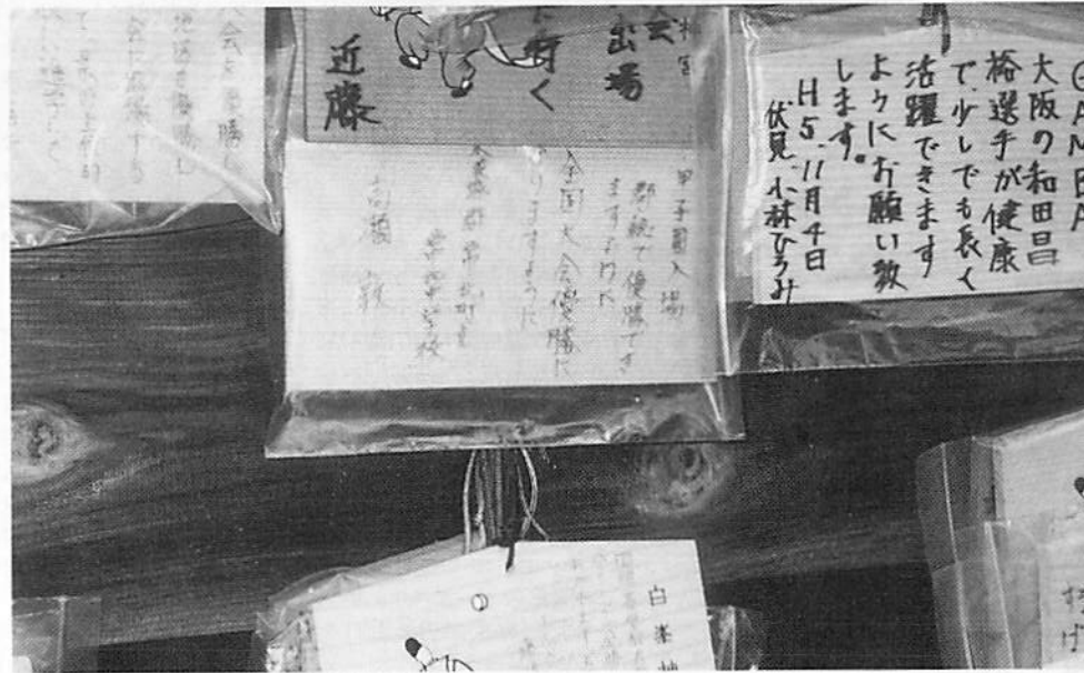
この絵馬のおかげでジーコは生き神様となれた。