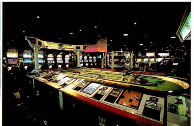
LEDライトが紅色に輝く「大人たちの遊び場」へと変身した2階のゲームフロア。シールプリントも大幅増強