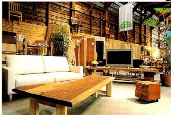
南米産モンキーポットの天板220000円、脚41500円、椅子25000円、ベンチ38000円