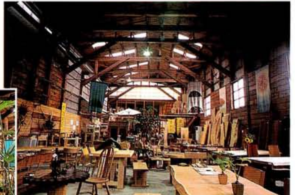
店内には約20種300枚の無垢板と約30点の家具が、9月には枚方の家具団地にもショップがオープンする