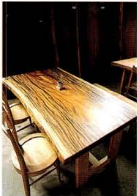
薄型液晶用のテレビ台は5万円代~。表面の磨きも木の風合いを損なわないよう植物性の透明オイルを使用する

デザイナーズやマスプロとは対極にあたるのが無垢板やその加工家具。自然の力で造形されたフォルムや風合いは「取った者勝ち」と言われるようにどれも唯一無二の存在。またテーブルなら脚での高さ調節や、天板を再加工して棚へ作り変えたりと、持ち主とともに変化し年を重ねていけるのも魅力。約300枚の無垢材と職人の個性で生まれる上質の家具で、生活もクオリティアップさせたい。