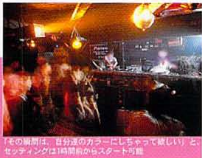
「その瞬間は、自分のカラーにしちゃって欲しい」と、セッティングは1時間前からスタート可能

かけがえのない一日だからこそ、自分らしく過ごしたい。なわで、通い慣れたハコで迎える2次会。オールジャンルOKのフリードリンク、ちょい華やかなイタリアンフードに加えて、MAX100人のたっぷりなダンス・スペースもDJブースも、全てがふたりと仲間のためにある。特別すぎないスペシャルが、気分でしょう。