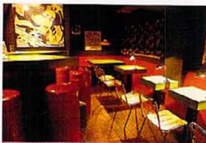
厳選メンバーでひさを付き合わせてじっくり飲むのも、大時で一丸となって飲み交わすことも自在な店内