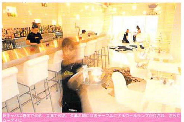
ピュアホワイトは最上階の40名、立食でOK。夕暮れ時には名作ゲームにアルコールランプが併設され、さらにムーディに

■京都市中京区木町通 三条上ル上大坂町516 JUNCTIONビル5F ■075-213-4441 ■12:00~翌4:00 無休