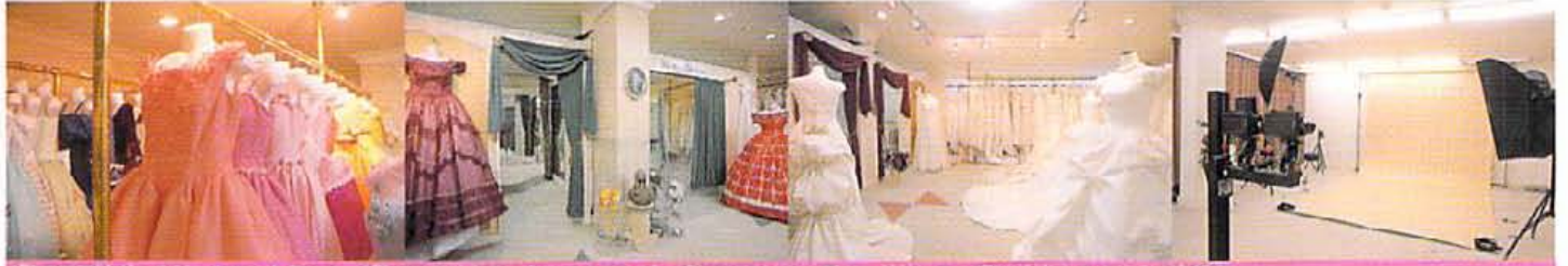
1階フロアはヴェルジュのエントランス、2階フロアはカラードレス&メンズ、3階フロアはウェディングドレス、4階は和装とスタジオの京都店

ホテル・レストランウェディング、海外挙式... シチュエーションに合わせて、必ず満足のゆく一着が見つげられる品揃え