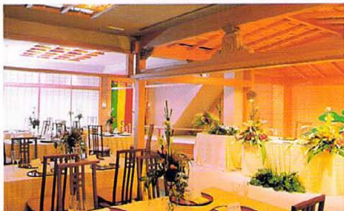
人前挙式も可能。披露宴は一日一組のみだから、石畳のテラスなどロケーションに華やかな写真撮影もゆっくりと