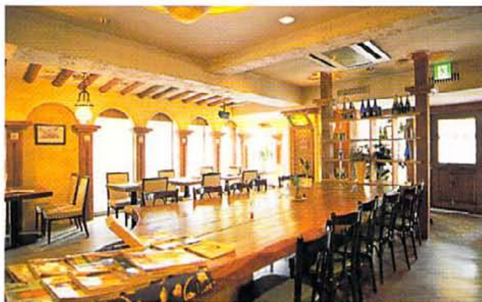
傾りはてなんてジマラナイ! 職人の作るウェディングケーキも丸ごと別売って、写真の料理はイメージのほんの一部

祝福を受ける二人も、ゲストも、幹事も 「誰もが」楽しめてこそ成功のパーティ とっておきの時間を過ごせる扉はここに