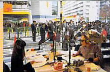
試験放送中のFM滋賀「E-RADIO」のサテスタ。今後もビッグなゲストを間近で見ることが出来る。

マリークワントカラーショップに投到する女子高生の群れ。オープン初日は彼女たちの凄まじい姿が数多くみうけられた。