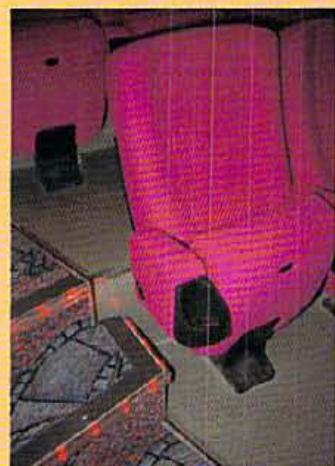
全席指定。ドリンクホルダーが付いたゆったりシート。映画館。OTSU 7シネマは関西で最も盛んだ映画館だ。