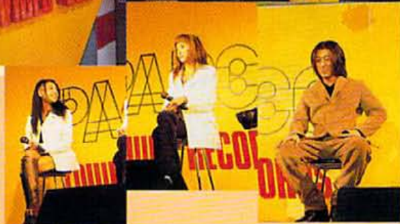
歌ってくれなかったのが残念！でも、dosは小学生から高校生に圧倒的な人気。3人の一挙一動に歓声上がる。

マリークワントカラーショップに投到する女子高生の群れ。オープン初日は彼女たちの凄まじい姿が数多くみうけられた。