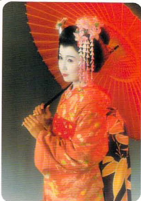
キャビネサイズ(13cm×18cm)フォト3カットは2週間後に郵送。パウチ加工のフォトカードは当日開封にもらえる。