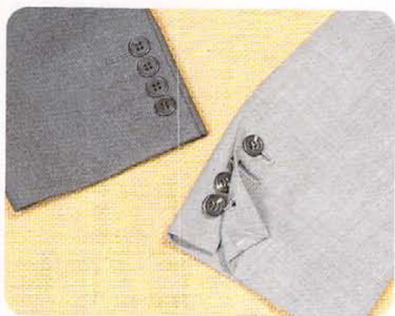
袖口のダミーホールにボタンが縫い込んである既製品(左)に比べ本開きスーツ(右)の精巧さは新鮮ささえ感じる。