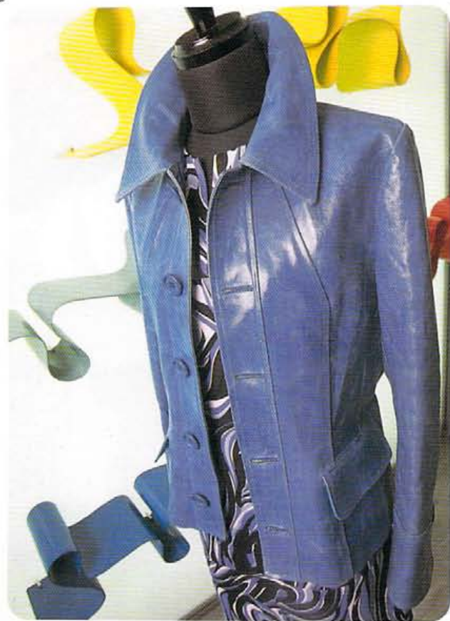
フィルムコーティングがキュートなジャケット(皮革100%)¥57000、マーブルが今年らしいワンピース¥25000。

「チャンス エンカウンター」とは、「突然の出会い」の意。言ってみれば「犬も歩けば棒に当たる」ってこと。ここではクラブフェイムが出会った良心店を、ラインナップ。好評につき、レギュラー化!