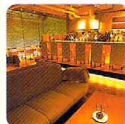
カフェ・ダイナー

「食べやすい沖縄料理 of 手頃な価格」。特にロブスターのタルタル焼きや、新鮮活魚の造りなど。鳥丸通近くで朝4時までの営業は残業で空っぽの胃も満たしてくれる。果実がゴロゴロ入った果実チューハイもおすすめ。