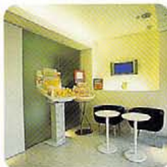
エステサロン・アートメイク