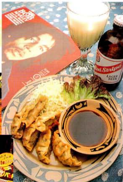
揚げギョーザ500円、コロケ1個180円、ヨーグルトパン、ジャマイカビール・レッドストライプは700円、赤ワインモロルージュはフルボトルで3000円、ハーブで1500円