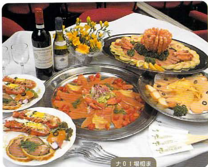
↑フォアグラのムース、スモークサーモンにオマール海老など、華やかなパーティメニュー。