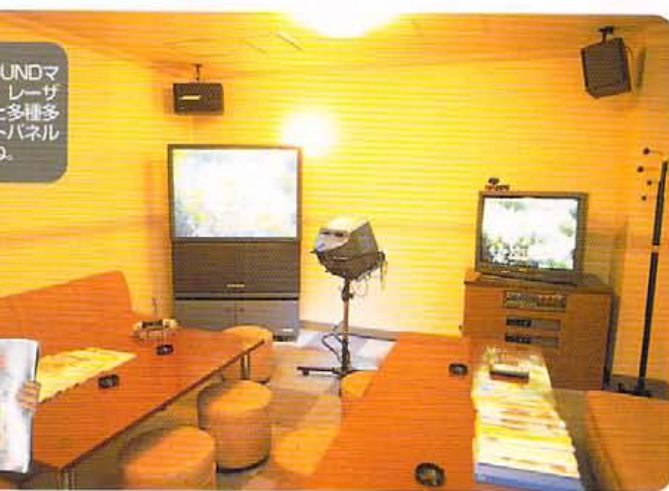
↑ワンドリンクなどの制度は全くなし! 平日19:00迄全ルーム半額サービスも実施中!