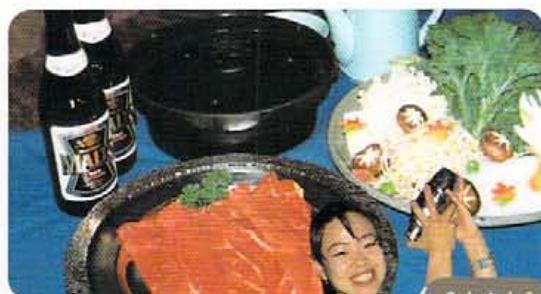
↑ビール、ウィスキー、ソフトドリンク飲み放題でうん付き。待たなしの2時間。