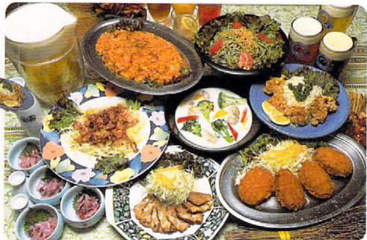
↑これが11月・12月のメニュー4人分！さらに1品プラスで内容もリッチな3980円プランも有。