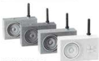
LEXON Tykho Radio

α-STATION WEB SHOP「Shop α」はコチラ! http://shop-alpha.com/